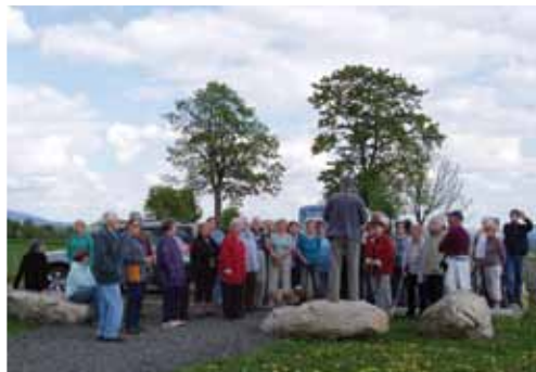
Před rozhlednou U Borovice u Vysokého nad Jizerou

Můžete se k nám přidat například 25. května na 31. ročník pochodu Krajem bitvy u Lipan, v květnu na vycházku ovocnou stezkou nebo s námi můžete jet o víkendy 6. - 8. září do Českého Krumlova a Novohradských hor.